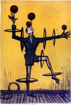
9-Jongleur, Edouard Buffet, 1968

Que cela soit en littérature, ou dans les arts graphiques, les jongleurs ont fasciné les artistes au début du XXème siècle. Plus encore, la figure du jongleur est reproduite quotidiennement de part le monde par les illustrateurs pour symboliser la gestion simultanée de plusieurs tâches. Certains en font même des dessins humoristiques !