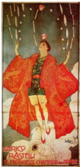
8-Rastelli, le plus grand jongleur

Si le concept de Star de la jonglerie peut nous sembler bien étranger, il fut un temps où les meilleurs des jongleurs atteignaient une célébrité mondiale, on parlait d’eux dans les journaux, les princes et les rois en faisaient leurs amis. Trois noms sortent du lot, Cinquevalli, Brunn, et Rastelli. Ce sont les Dali, Hendrix, Hugo de la jonglerie, ceux qui ont inspiré les autres à se dépasser et les inspirent encore !