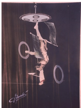
7-Les Reverhos sont à ce jour inégalés

Certains exploits en jonglerie sont tellement incroyables, qu’il vaut mieux les voir pour les croire. Et les décrire, cela prendrait trop de temps. Que cela soit les jongleurs de force, les jongleurs acrobates, les groupes de jongleurs, les images sélectionnées dans cette partie sont exceptionnelles et les figures souvent inégalées !