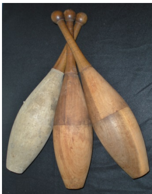
2- Massues Van Wyck, fin du XXème siècle. Premières massues produites en masse.

Les balles ont beau être l’objet de jonglerie le plus connu, encore fallait-il l’inventer ! Si maintenant les objets massues, balles, anneaux, diabolos, bâton du diable sont répandus, leur histoire est un véritable témoin de recherches des jongleurs pour mieux jongler, pour jongler avec autre chose, jusqu’à la production de masse des objets standardisés. Mais n’allez pas croire que tout a été inventé ! De nouvelles balles et massues, diabolos etc... sortent chaque année pour le plus grand plaisir des jongleurs.