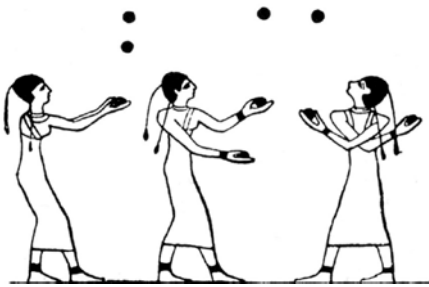
1 - Jongleuses de Beni-Hassan, 2000 av. J.-C. Egypte