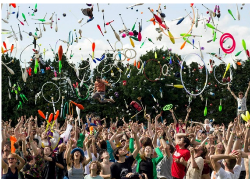
4-Le Toss'Up ! Convention de Bruneck 2015

Les conventions de jonglerie sont des lieux d'échange et de rassemblement pour les jongleurs. On y vient pour se retrouver, suivre ou donner des ateliers, voir des spectacles, en prendre plein les yeux, découvrir les nouveaux talents, les nouvelles idées. Apparues au milieu des années 1950, les plus grandes conventions rassemblent jusqu'à 6000 personnes, témoins de l'ampleur du développement de la jonglerie professionnelle et de loisir dans le monde.